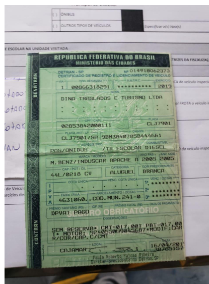
Documento veículo CLJ7901