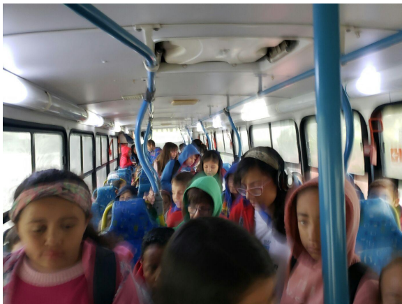
Alunos em pé