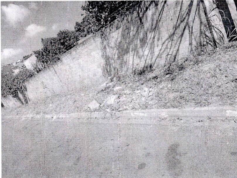
Rua das Gardênias