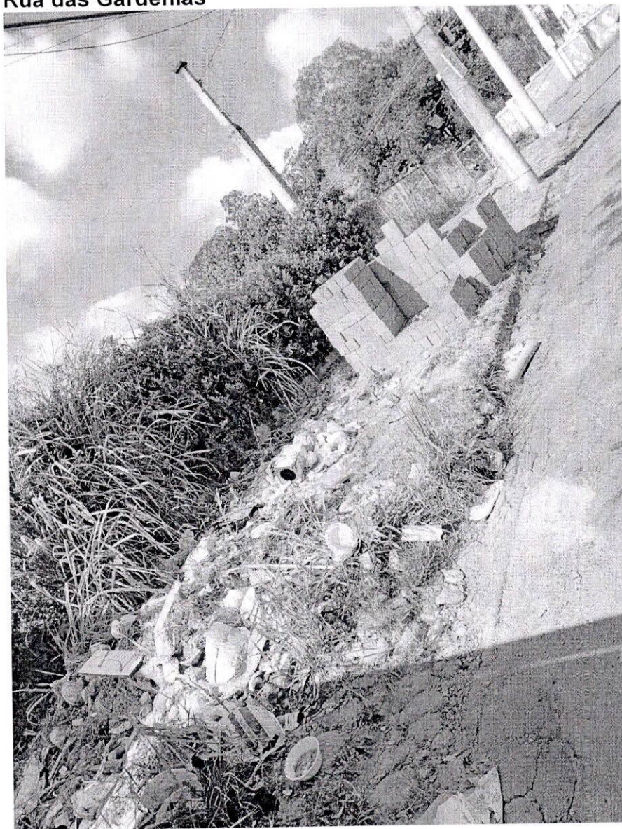
Rua das Gardênias