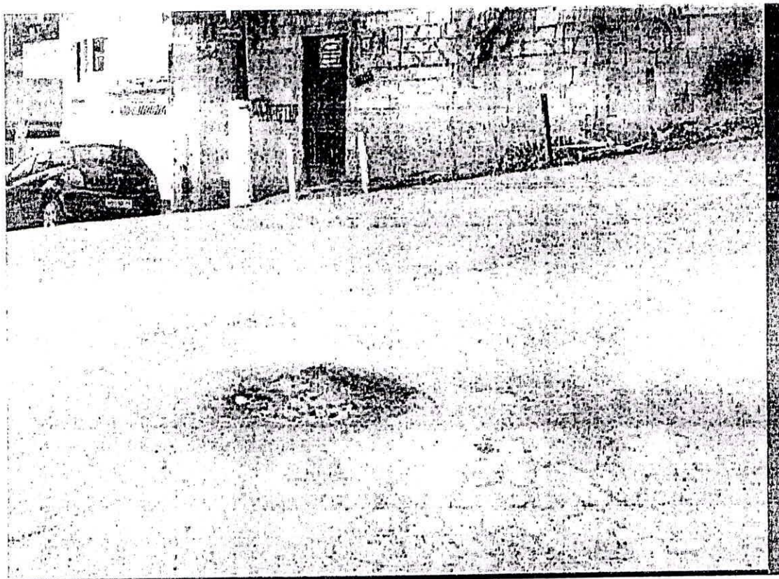
RUA COSMORAMA ALTURA Nº 550