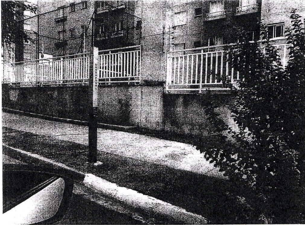
Ponto de ônibus instalado no Portal dos Ipês, sem lixeira