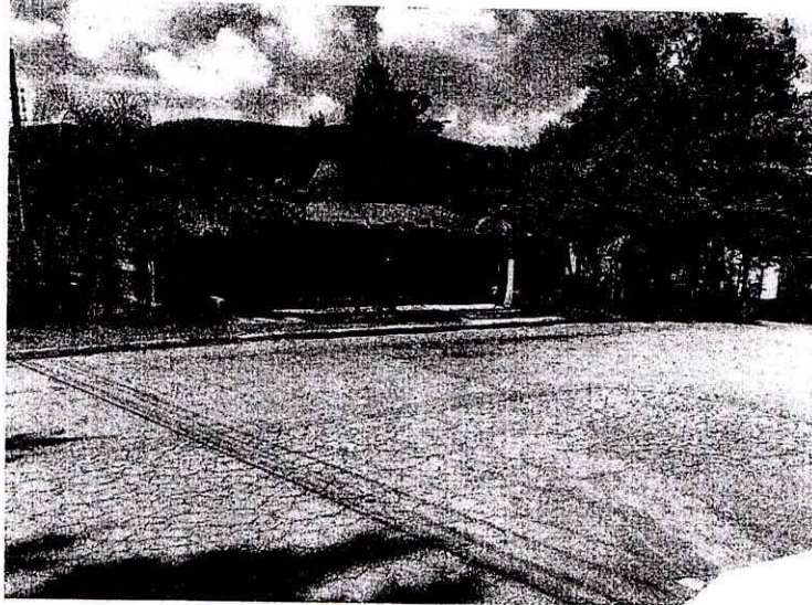
Ponto de ônibus instalado no Maria Luiza.

DEPARTAMENTO TÉCNICO LEGISLATIVO Recebido em