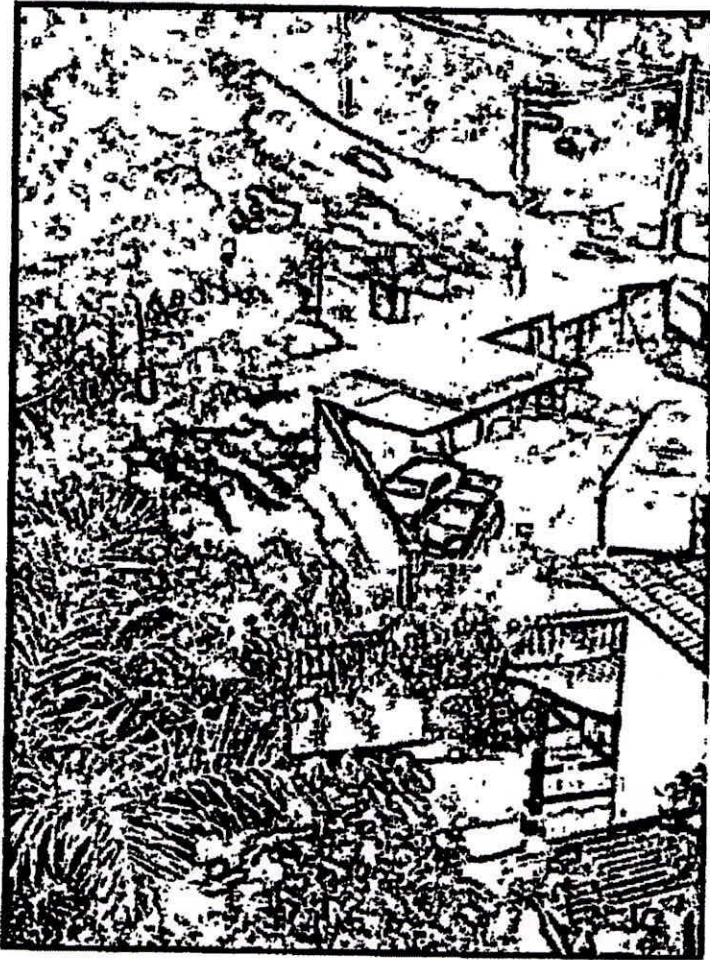
Bairro Santa Terezinha

DEPARTAMENTO TÉCNICO LEGISLATIVO recebido em