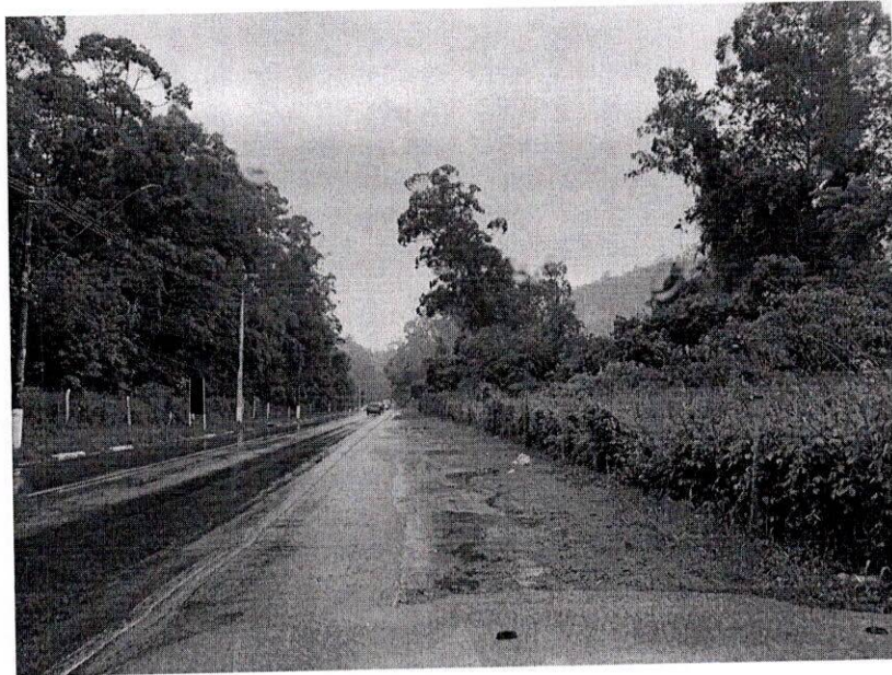
Av. Prefeito Juvenal Ferreira dos Santos.