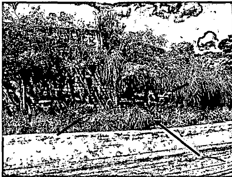
Pontos de fissura no muro