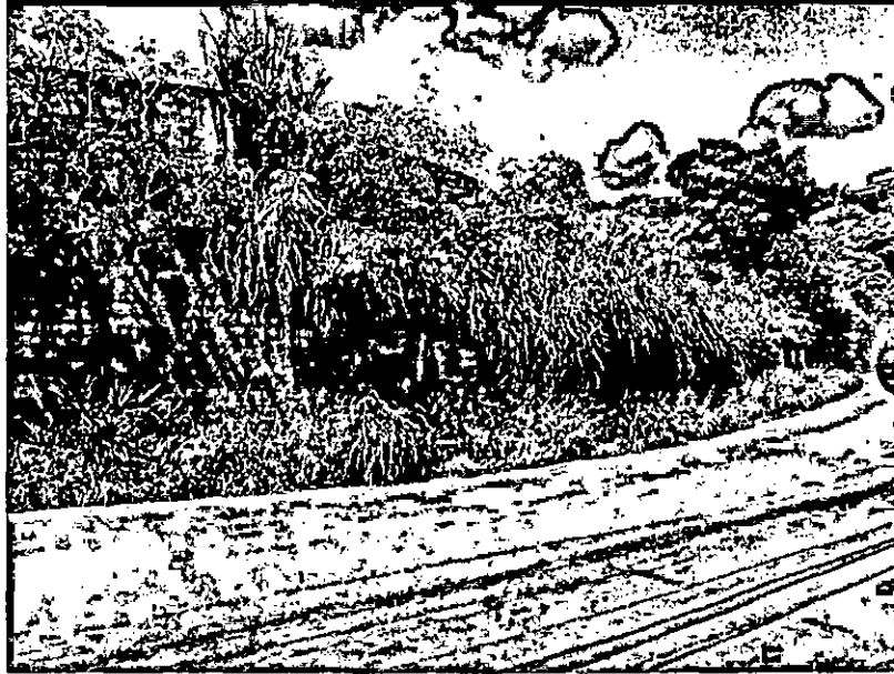
Terreno sem calçada