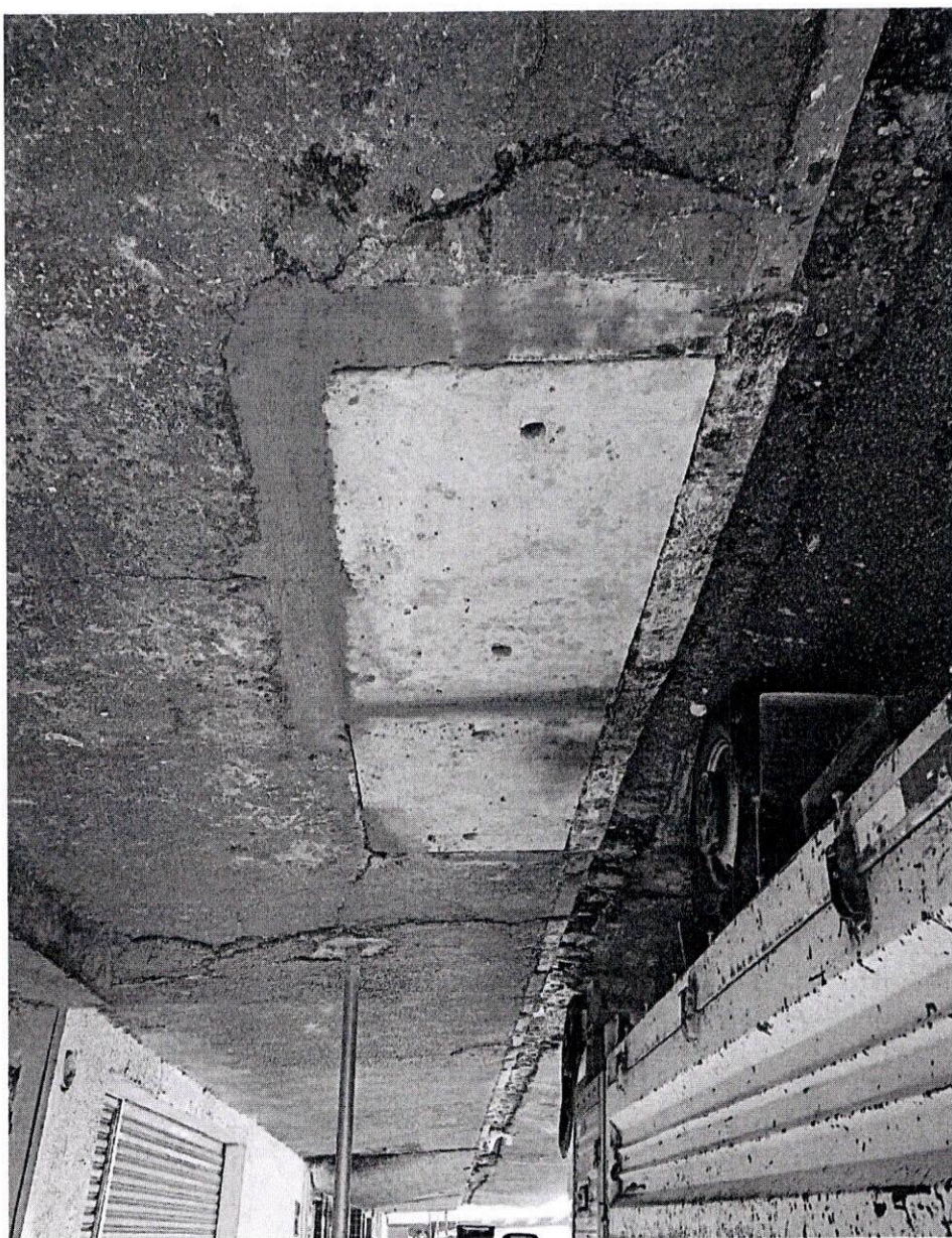
Indicação nº 421