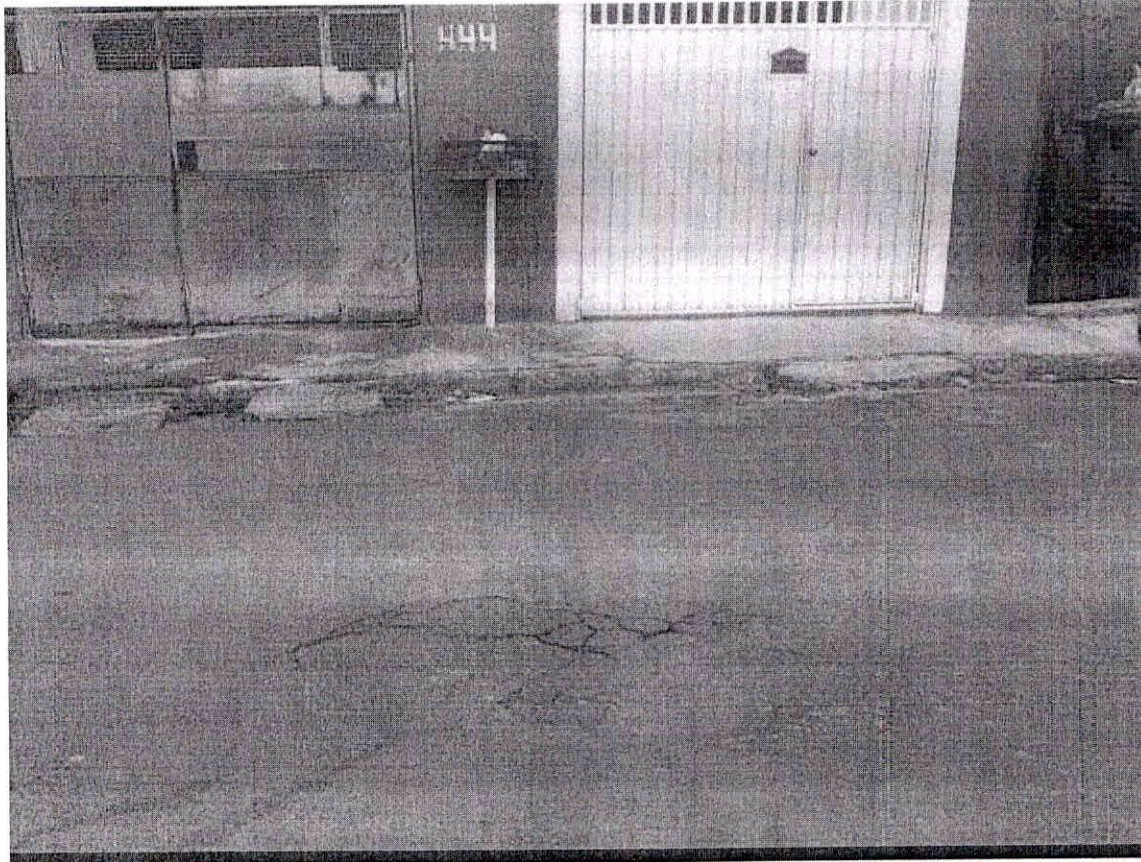
RUA CORUMBATAÍ ALTURA Nº 444